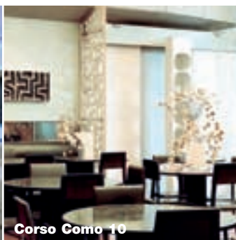
Corso Como 10