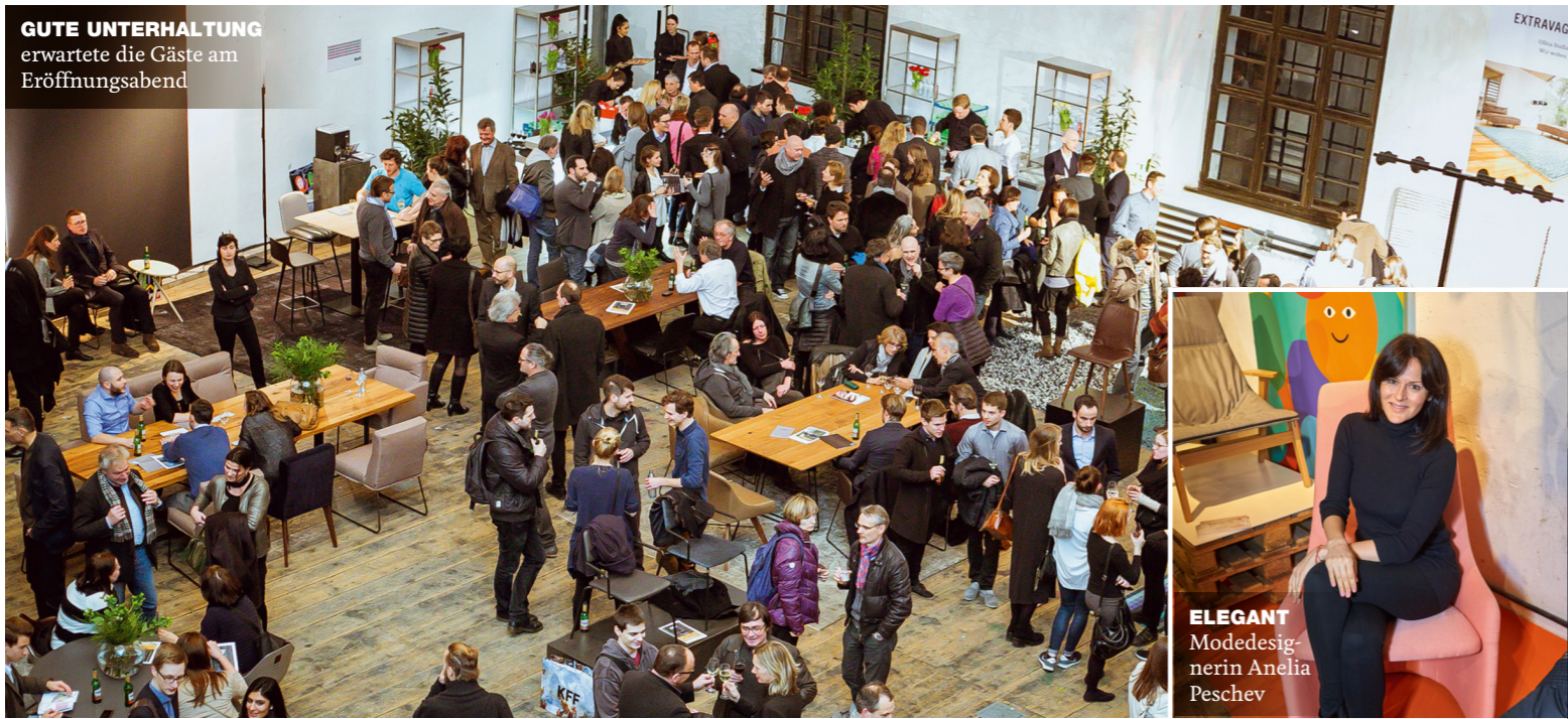
GUTE UNTERHALTUNG erwartete die Gäste am Eröffnungsabend