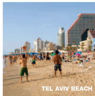
TEL AVIV BEACH

Die wundervolle Strandstadt wird von ihren Einwohnern auch „die Blase“ genannt. Kein Wunder, spürt man hier doch erstaunlich wenig von dem, was die Nachrichtenlage über den Nahen Osten vermuten lassen würde. Die Tel Aviver sind kosmopolitisch, gehen gerne aus, lieben gutes Essen und zelebrieren das Leben. Schon wegen ihrer Menschen, der Kultur und positiven Energie ist die mit 400.000 Bewohnern zweitgrößte Stadt Israels eine Reise wert