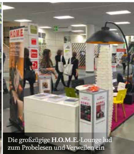
Die großzügige H.O.M.E.-Lounge lud zum Probelesen und Verweilen ein