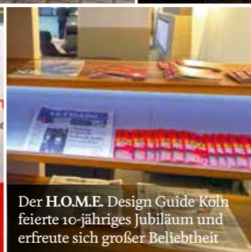
Der H.O.M.E. Design Guide Köln feierte 10-jähriges Jubiläum und erfreute sich großer Beliebtheit