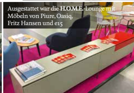
Ausgestattet war die H.O.M.E.-Lounge mit Möbeln von Piure, Oasiq, Fritz Hansen und e15