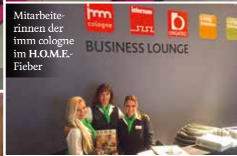
Mitarbeiterinnen der imm cologne BUSINESS LOUNGE im H.O.M.E.-Fieber