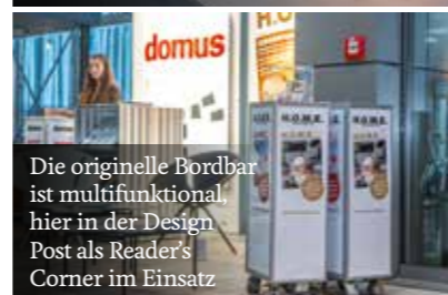
Die originelle Bordbar ist multifunktional, hier in der Design Post als Reader's Corner im Einsatz