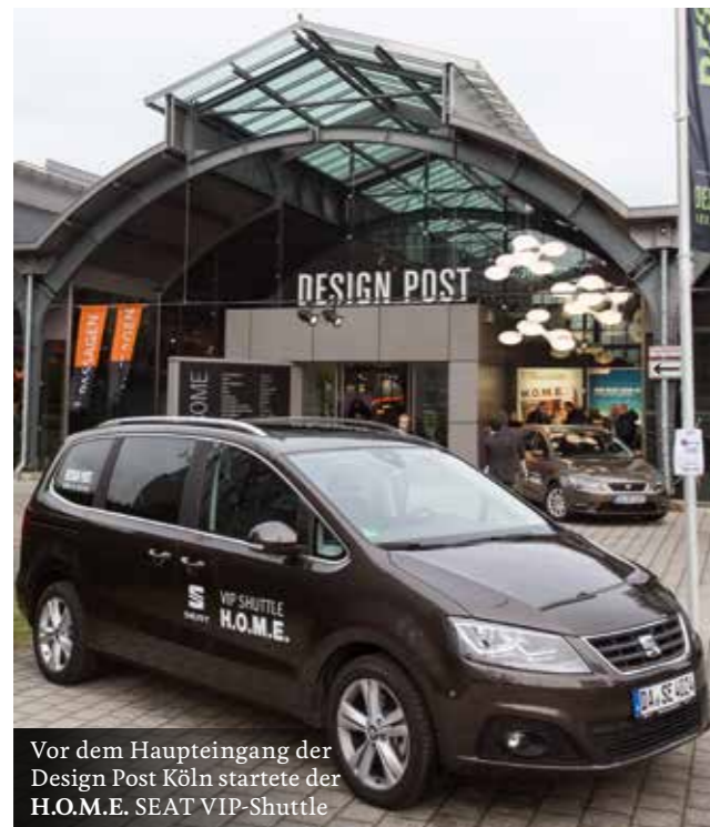
Vor dem Haupteingang der Design Post Köln startete der H.O.M.E. SEAT VIP-Shuttle