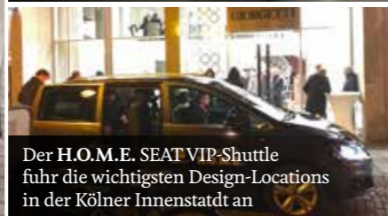
Der H.O.M.E. SEAT VIP-Shuttle fuhr die wichtigsten Design-Locations in der Kölner Innenstadt an