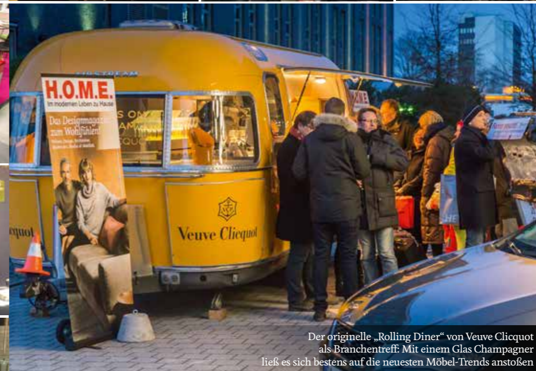
Der originelle „Rolling Diner“ von Veuve Clicquot als Branchentreff: Mit einem Glas Champagner ließ es sich bestens auf die neuesten Möbel-Trends anstoßen