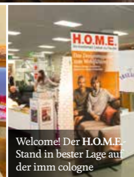
Welcome! Der H.O.M.E.-Stand in bester Lage auf der imm cologne