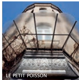
LE PETIT POISSON